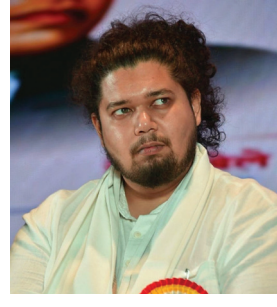
राष्ट्रीय युवा अध्यक्ष