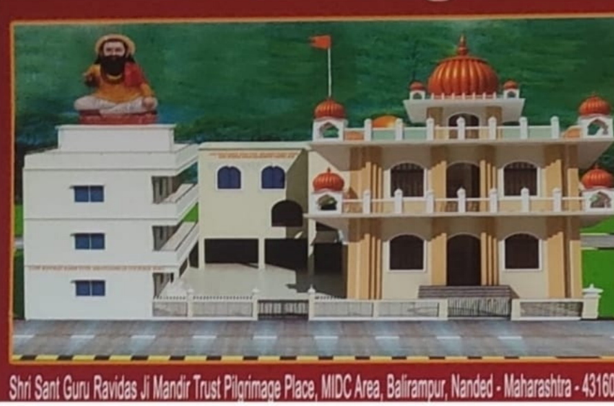
Shri Sant Guru Ravidas Ji Mandir Trust Pilgrimage Place, MIDC Area, Balirampur, Nanded - Maharashtra - 431603