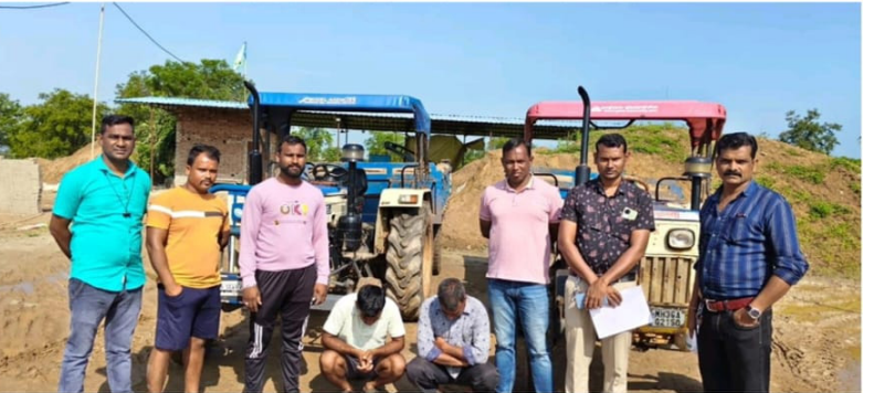
जप्त केलेला मुद्देमाल: १. स्वराज ७३५ ट्रॅक्टर (MH36 AR0389) आणि विना क्रमांकाची ट्रॉली + १ ब्रास रेती: एकूण ७,०६,०००/- रुपये. २. स्वराज ७३५ ट्रॅक्टर (MH36 AG2150) आणि ट्रॉली (MH36 AL8092) + १ ब्रास रेती: एकूण ७,०६,०००/- रुपये. एकूण मुद्देमाल: १४,१२,०००/- रुपये.

अंदाजे १ ब्रास रेती असा एकूण ७ लाख ६ हजार रुपयांचा मुद्देमाल जप्त करण्यात आला. तसेच, दुसऱ्या कारवाईत, निळ्या-पांढऱ्या रंगाचा स्वराज ७३५ कंपनीचा आणखी एक ट्रॅक्टर (क्रमांक MH36 AG2150) आणि त्यावरील निळ्या रंगाची ट्रॉली (क्रमांक MH36 AL8092) व अंदाजे १ ब्रास रेती असा एकूण ७ लाख ६ हजार रुपयांचा मुद्देमाल जप्त करण्यात आला. दोन्ही घटनांमधील मुद्देमालाची एकूण किंमत १४ लाख १२ हजार रुपये इतकी आहे. आरोपी हे विना परवाना अवैध रेती वाहतूक करत असल्याचे निष्पन्न झाले. फिरोदीच्या लेखी रिपोर्टवरून तुमसर पोलीस स्टेशनमध्ये अपराध क्रमांक ६५१/२०२५ अन्वये भारतीय न्याय संहिता कलम ३०५ (ई), ३ (५), महाराष्ट्र जमीन महसूल अधिनियम कलम ४८ (८) आणि पर्यावरण संरक्षण अधिनियम कलम ७, ९ नुसार गुन्हा नोंद करण्यात आला आहे. सदरची कारवाई पोलीस अधीक्षक नूरल