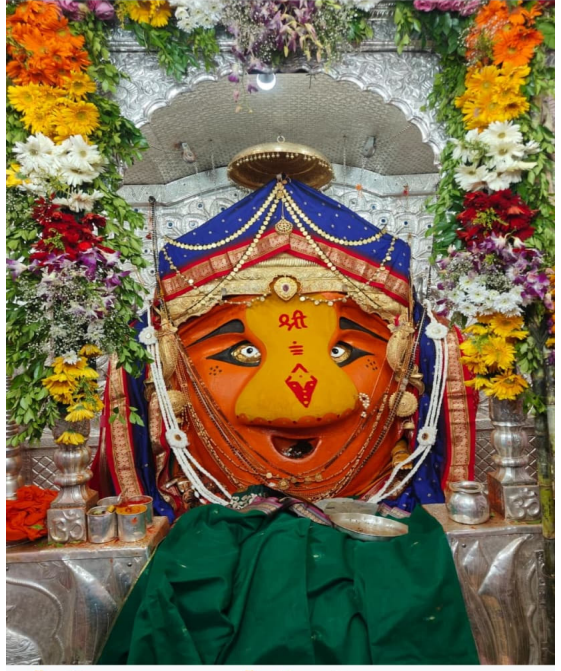
!!जय जगदंब!! अश्विन नवरात्र उत्सव माहूरगड दिनांक 29/09/25श्री रेणुका मातेचे नवरात्र उत्सवातील आजचे दर्शन 2:12 PM