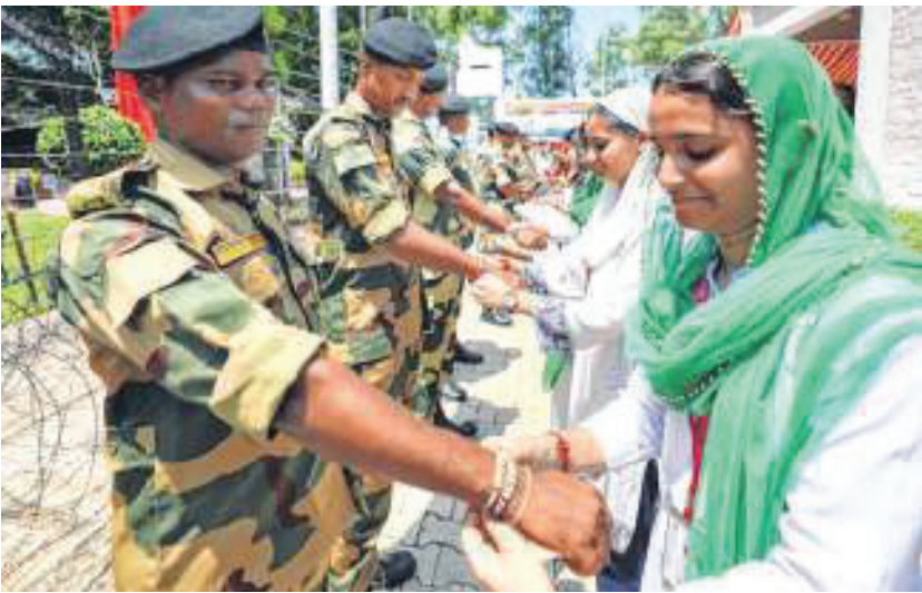
जम्मू येथे रक्षाबंधननिमित्त सीमा सुरक्षा दलाच्या जवानांना राखी बांधताना स्थानिक महिला.