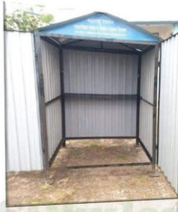
योजनेसाठी खालील अटी व शर्ती विहित करण्यात आलेल्या आहेत. 1) अर्जदार हा महाराष्ट्र राज्याचा रहिवासी असावा. 2) अर्जदार अनुसुचित प्रवर्गातील चांभार