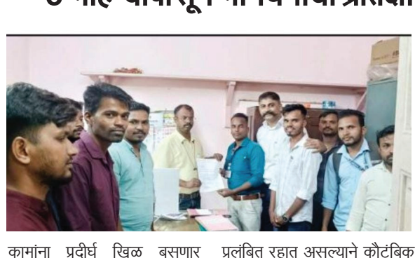
कामांना प्रदीर्घ रिखळ बसणार असून त्याचे दुरगामी परिणाम मात्र मजुरांच्या कुटुंबाला आणि बालव्यवसाया भांगवते लागणार आहेत. सन 2006 पासून रोजगार सेवक नरेगाचे काम प्रामाणिकपणे करत आहेत. सातत्याने मानधन प्रलंबित रहात असल्याने कौटुंबिक वातावरण ढवळून निघत असून अनंत अडचणींना तोंड द्यावे लागत असल्याचे रोजगार सेवक सांगत आहेत. माे डिसेंबर पासून आजतागायत सलग 5 महिने मानधन मिळाले नसल्याने केवळ