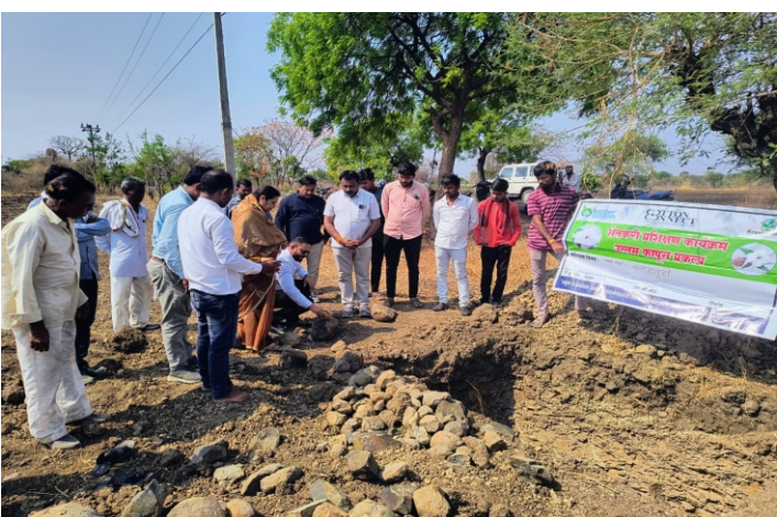
जलतारा ची खड्डे करण्यासाठी जेसीपी आणि टक्तर देऊन मदत केली आहे या